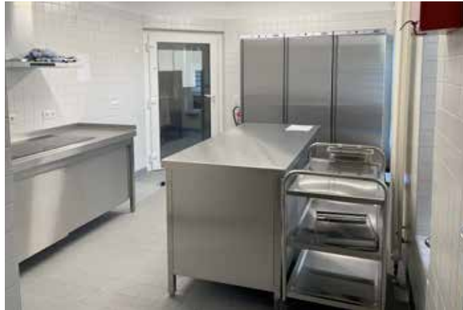
Die neue Küche

Der ehemalige Rollen- und Regelspielraum wird nun,