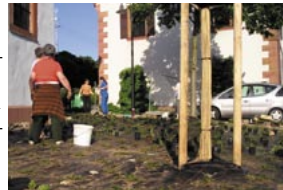
Hunderte von Setzlingen