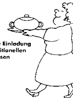
Herzliche Einladung zum traditionellen Eintopfessen

Der Obst- und Gartenbauverein Miesau wird seine Veranstaltung zum Erntedank am 6. Oktober durchführen.